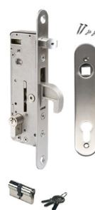
Serrure et cylindre