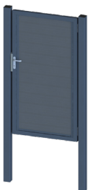
portail pivotant simple